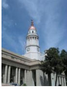
قطاع خدمة المجتمع و تنمية البيئة كلية طب _ قصر العيني